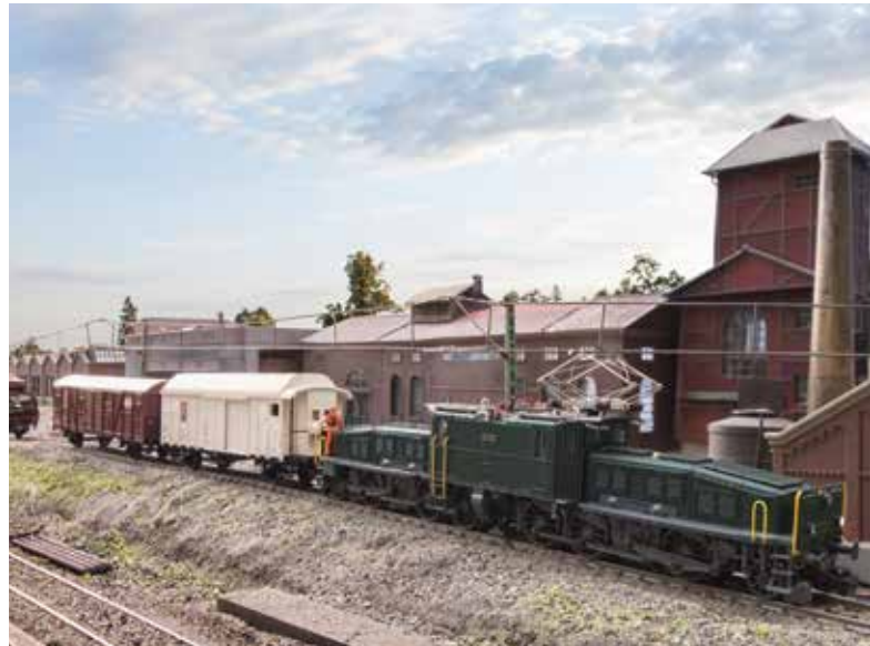
Klassiker vom Erfinder der Modelleisenbahn Märklin: Das „Krokodil“ der Schweizerischen Bundesbahnen

Das Hobby Modelleisenbahn ist konzentrierte Entschleunigung: planen, sägen, löten, programmieren, begrünen – und am Ende fährt etwas, das man selbst geschaffen hat. Die Modelleisenbahn macht Technik begreifbar (vom Dampftriebwerk bis zur E-Lok), ist Gesprächsanlass in der Familie und – dank moderner Digitalsteuerungen – so intuitiv wie nie. Und die Einstiegshürden sind niedrig: Startsets mit Zentrale, Soundlok und robusten Gleisen eröffnen binnen Minuten die erste Runde. Wer will, baut später etappenweise aus: vom Rangierbrett am Schreibtisch bis zur eigenen Keller-Topografie.